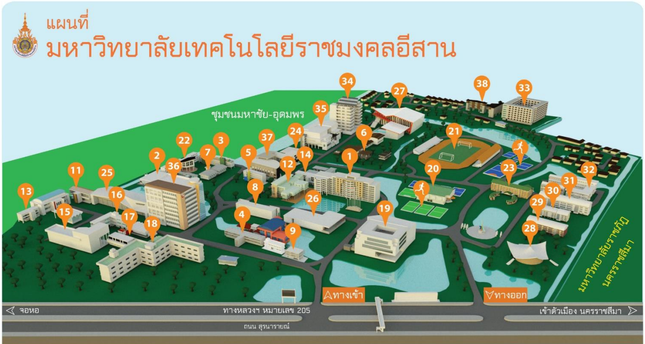
จัดทำโดย : งานประชาสัมพันธ์และเผยแพร่