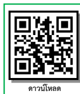
ดาวน์โหลด

*** 2. สามารถดาวน์โหลดขั้นตอนการรายงานตัวหรือหนังสือขอผ่อนผันเอกสารหลักฐานการรายงานตัวฯ ได้ที่ https://regis.rmuti.ac.th/online/