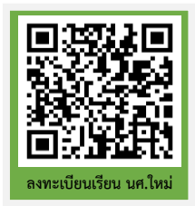
ลงทะเบียนเรียน นศ.ใหม่

ขั้นตอนที่ 5 ลงทะเบียนเรียนนักศึกษาใหม่และพิมพ์ใบรายงานการลงทะเบียน/ใบแจ้งชำระเงิน ปีการศึกษา 2566 ผ่านระบบบริการการศึกษา (ESS) https://ess.rmuti.ac.th/Rmuti/Registration/ ซึ่งจะมีรายการค่าใช้จ่าย ค่าประกันของเสียหาย ค่าประกันอุบัติเหตุ และค่าหอพัก นำไปชำระเงินผ่านธนาคารกรุงไทย จำกัด(มหาชน)/ ธนาคารกรุงศรีอยุธยา จำกัด(มหาชน) ได้ทุกสาขาทั่วประเทศ วันที่ 7 - 9 มิถุนายน 2566