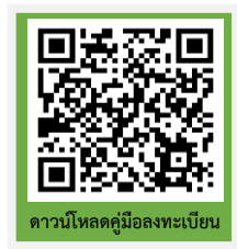
ดาวน์โหลดคู่มือลงทะเบียน